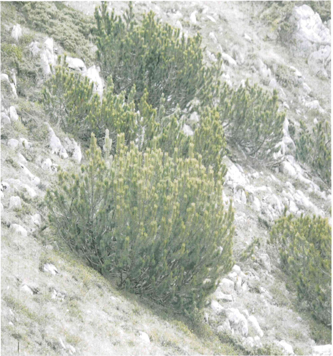
Бор кривуљ