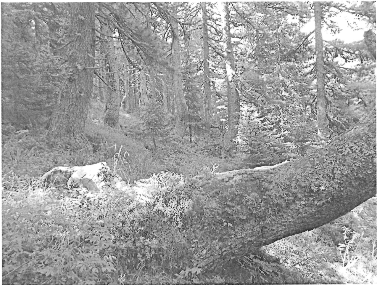
Шума молике