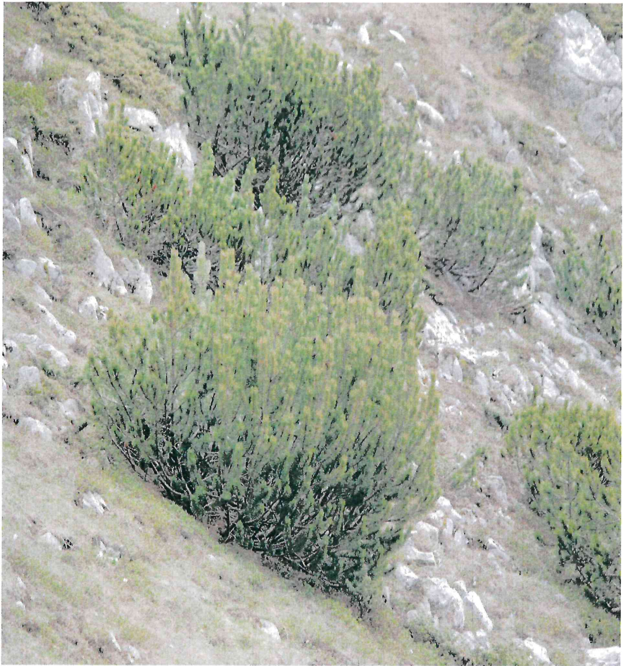
Бор кривуљ