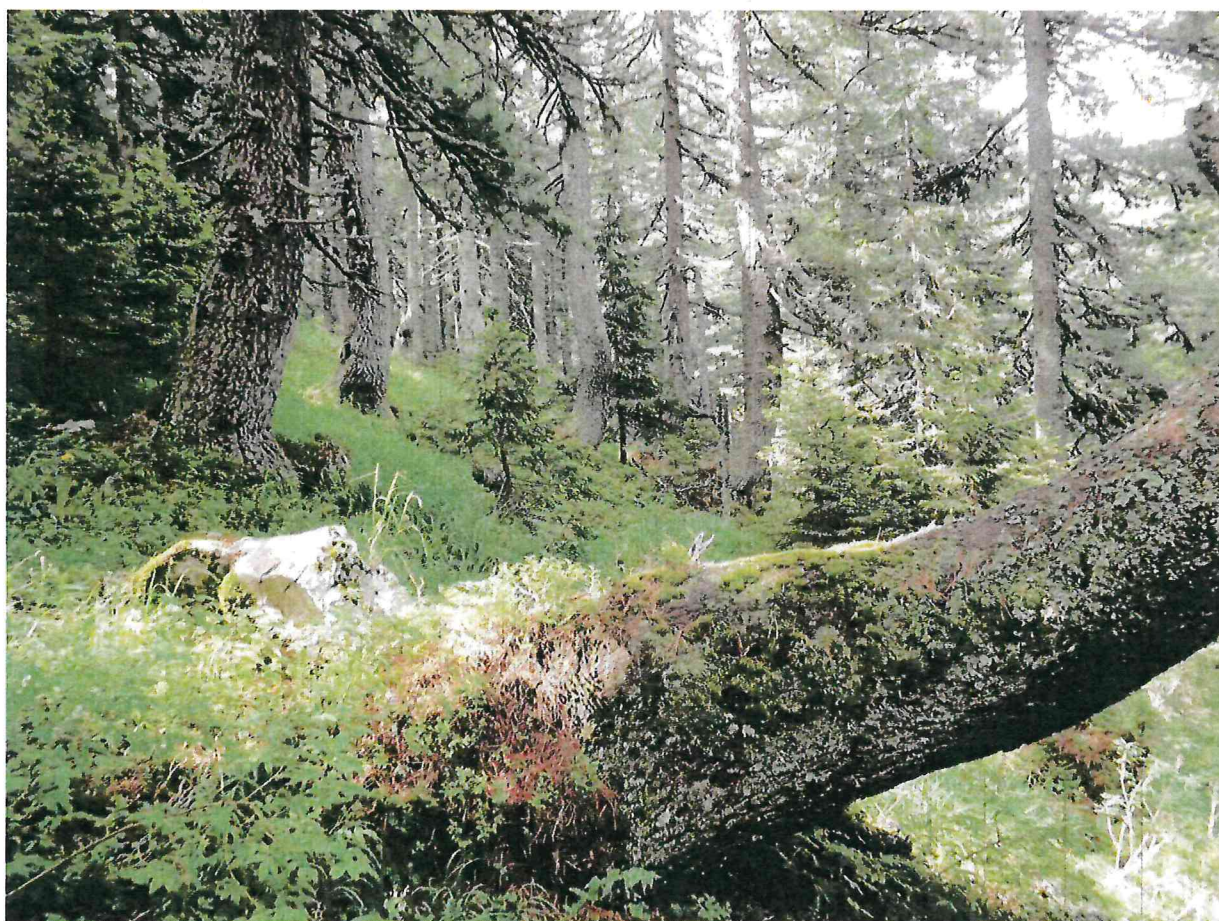
Шума молике