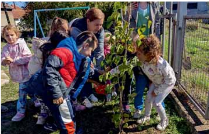
ШГ „Северни Кучај“ – Кучево