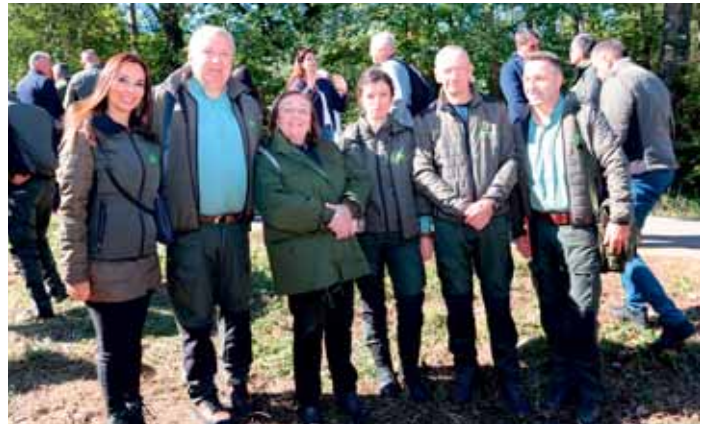
Учесници акције њошумљавања на Кошуйњаку