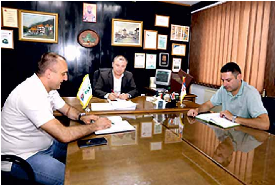
Директор са сарадницима

Газдинство газдује шумама јабланичког шумског подручја са 16 газдинских јединица на површини од 39 604 ha и врши стручно техничке послове на површини од 107 975 ha и дозначимо 67 702 m 3 приватних шума, на подручју шест општина. У државним шумама располаже укупном запремином дрвне масе од 7 961 742 m 3 , просечно 201 ha/m 3 годишњи прираст је 202 346 m 3