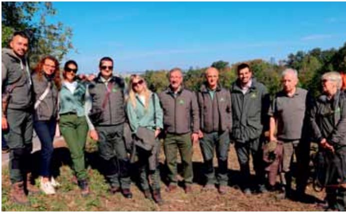
Учесници акције њошумљавања на Кошуйњаку