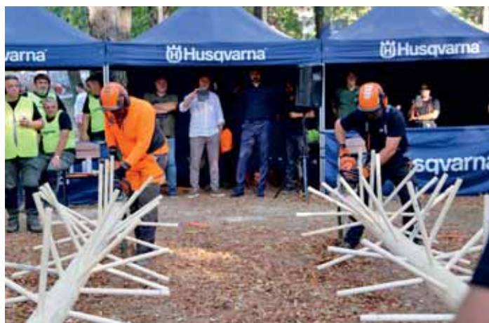
Кресање грана – егзибиција Нешкових - Зујић

Репрезентативци Србије током јула и августа прошли су четири недеље припрема на Златару и делиблатској пешчари. На прелепој планини