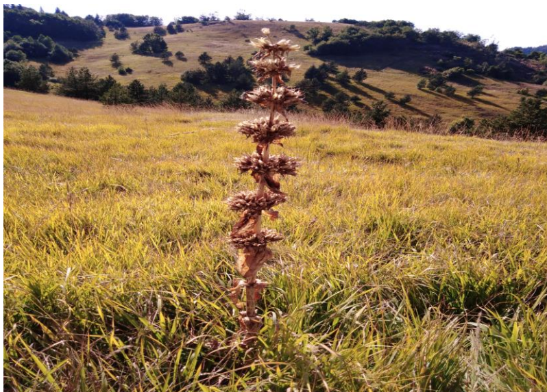
Линцура ( Gentiana lutea L.) на подручју Јадовника

Најређи и најугроженији тип станишта на подручју Озрена и Јадовника су водена и влажна станишта која се у фрагментима срећу на просторима Тичјег поља, Змајевског потока, дуж врхова Јадовника и другде. Највеће површине ових типова станишта налазе се у околини села Милаковићи и треба обратити посебну пажњу да се при планирању развоја овог подручја не изврши физичко нарушавање или дренажа овог подручја и припадајућих водотокова.