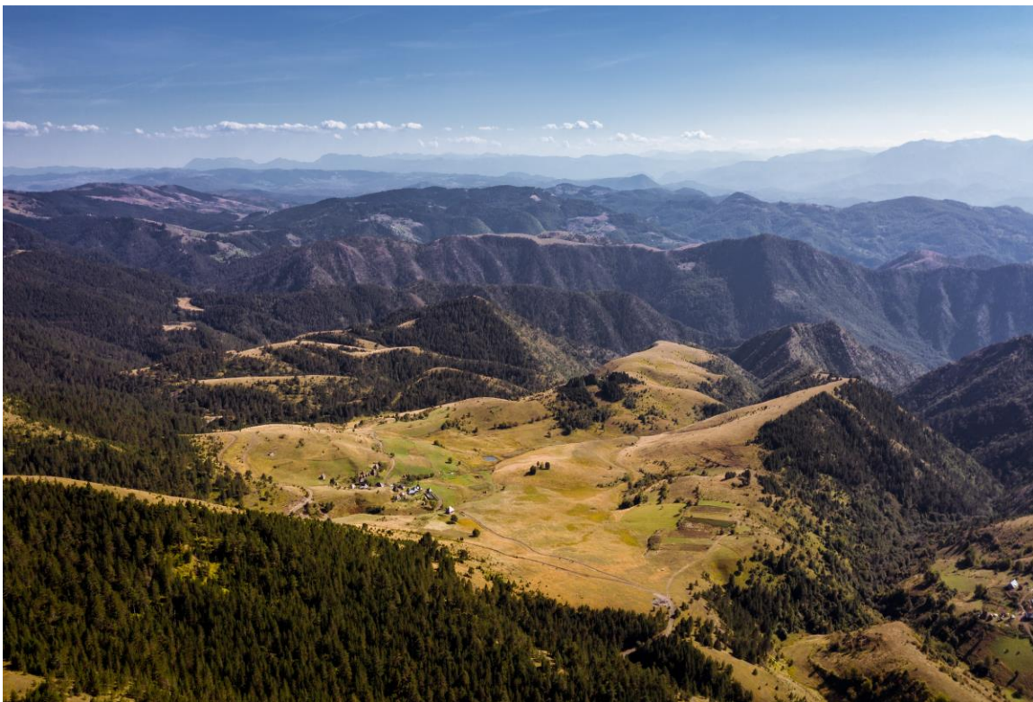
Поглед са Озрена

У клисурама, усеченим у падине Озрена и Јадовника, налази се и тиса - терцијарни реликт, што овдашњим шумама даје посебан значај.