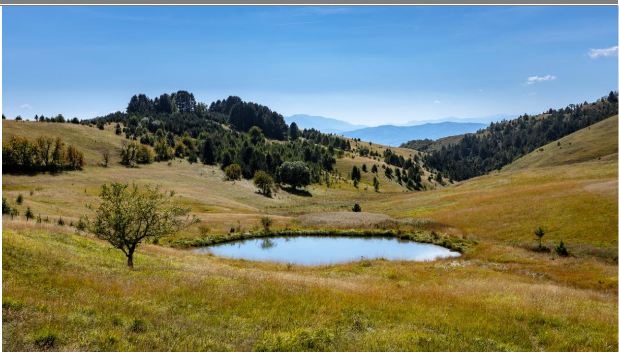
Предео изузетних одлика „Озрен-Јадовник“ - Тичје поље