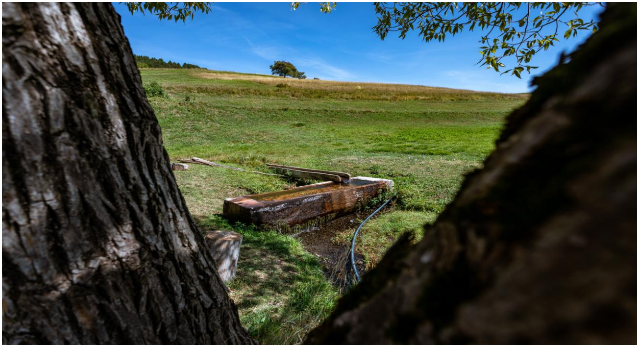
Извор у Тичјем пољу