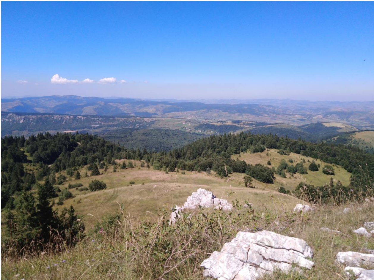
Катунић, највиши врх Јадовника, 1733 м.н.в

У домену амбијенталних одлика заштићено подручје карактеришу три потпуно различита типа предела. На северу, на подручју планине Јадовник простиру се велики комплекси планинских пашњака. Заравњена планинска површ, са бројним облицима површинске ерозије и са врло малим површинама под високом вегетацијом, представљају карактеристичан пејзаж овог краја. На југу простиру се благо заталасане падине планине Озрен карактеристичне по великим површинама под ливадама, великим бројем мањих извора и не малим површинама под четинарском и листопадном вегетацијом. И падине Озрена и падине Јадовника се на јужном и западном ободу завршавају у виду врло стрмих падина, а не ретко и вертикалних отсека који падају у клисуре Дубочице и Лима. Иако су окружени насељима, ови делови заштићеног подручја представљају део исконске нетакнуте природе и у пејзажном погледу су изузетно атрактивни.