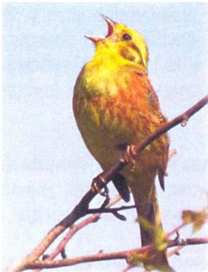
Emberiza citronella – стрнадица жутовољка

Фауна птица планине Кукавица је веома слабо истражена. Прилог са пописом фауне птица забележен јула 2006. године унутар граница шумског резервата на гребену Кукавице и око брда Фурниште, садржи следеће птице: