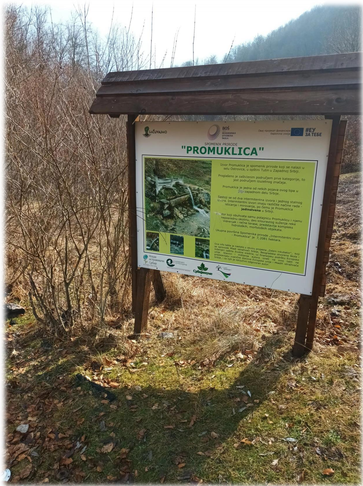
Инфо табла СП „Промуклица“