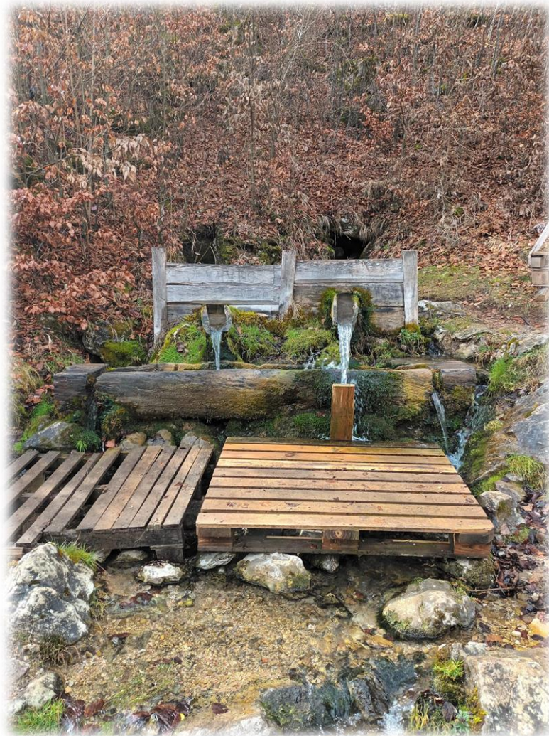
Интермитентни извори Промуклица