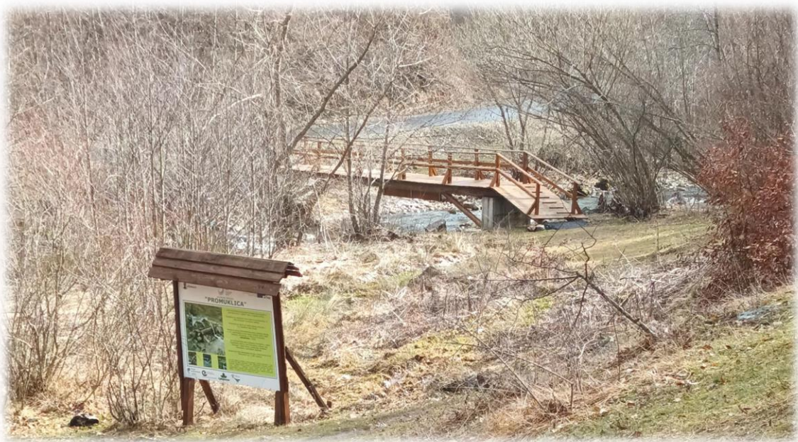
Примери уређења СП „Промуклица“