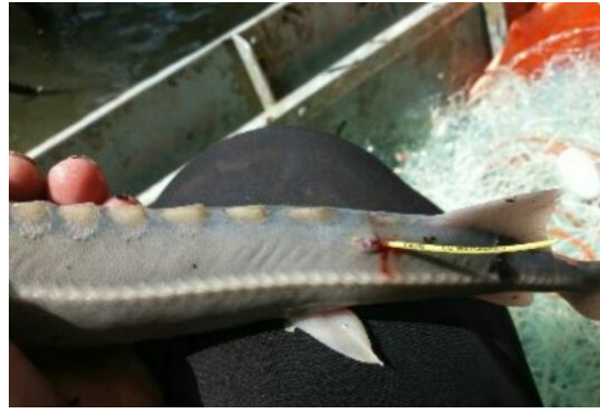
Слика : Примерак означен маркицом са натписом (број кечиге и EU MEASURES)

Овај податак не уноси се у евиденцију улова привредног рибара, већ га је потребно уписати на посебан лист папира и предати приликом предавања месечних евиденција.